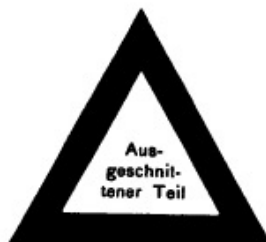
Im 3. und 4. Absatz des Art. 9 angegebenes Zeichen